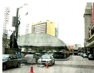
“食代广场”底楼露天广场拥有超过1000个宽阔的停车位，解决你寻找停车位的烦恼。