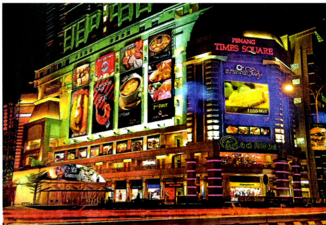
玮力产业集团属下的檳城时代广场联合州内多个著名饮食界人士，为北马人带来第一个名符其实的美食天堂“食代广场”。

他说，“食代广场”与众不同的是一全冷气设备、走廊都是一种不同凡响的舒适感，以美食为吸引力，提供市场需要的美食，加上形象卫生、有卖相、超低价格及新鲜的食物，为檳城的年轻人、上班族及家庭呈现“食代广场”。