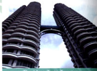
The View Twin Towers