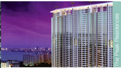
The Peak Residences