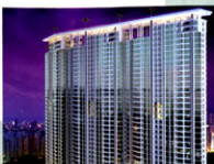
The Peak Residences