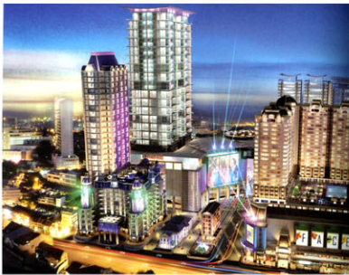
Penang Times Square